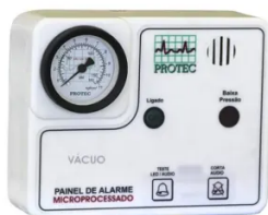
Painel Alarme Rede de Vácuo Microprocessador - Protec