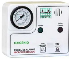
Painel Alarme Rede de Oxigênio Microprocessador - Protec