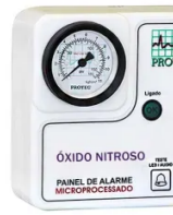
Painel Alarme Rede de Óxido Nitroso Microprocessador