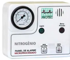
Painel Alarme Rede de Nitrogênio Microprocessador - Protec